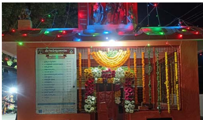
కూసుమంచి మార్చి 07 ప్రజాజ్యోతి

- అర్ధరాత్రి దాటిన నుండి ప్రారంభమైన అభిషేకాలు - ముస్తాబైన గణపేశ్వరాలయం - పోలీసుల పటిష్ట బందోబస్తు