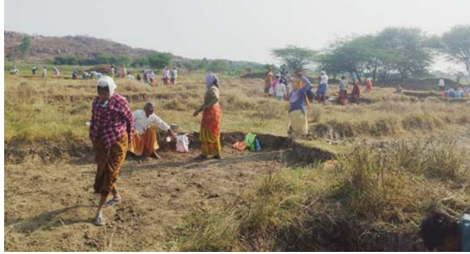
ఇస్తున్నారని కూలీలు వాపోతున్నారు. అందులో సగం హాజరు వేసిన వ్యక్తికి అందుతున్నట్లు సమాచారం. ఇలాంటి వారిపై ఉన్నత అధికారులు కఠిన చర్యలు తీసుకోవాలని గ్రామస్తులు కోరుతున్నారు.

ఉపాధిహామీ పథకం అక్రమాలకు కేరాఫ్ గా మారుతోందా?.. అంటే జననే సమాధానమే వస్తోంది చాలామంది నుంచి. క్షేత్రస్థాయిలో ఈ పథకాన్ని నిర్వహించేవారికి బంగారు గుడ్డు పెట్టే బాతులా మరుతోంది పథకం. మూడు మస్టర్లు ఆరు హాజరు అన్న చందంగా మారుతున్నది ఉపాధి హామీ పథకం. ఈ పథకంలో అంతా ఉన్నది లేనట్లు లేనిది ఉన్నట్లు అంతా కనికట్టుగా మారింది. తప్పుడు మస్టర్లు, పనుల్లో అక్రమాలు, వేతనాల్లో కోత వంటి అక్రమాలకు ఉపాధి హామీ పథకం చిరునామాగా ఉంది. సామాజిక తనిఖీలు, ప్రజావేదిక విచారణల్లో రూ.లక్షల్లో అవినీతి బహిష్కరణ తప్పింపుకు అక్రమాల పరంపర మారడం లేదు. అలాంటి మండలంలోని కల్లెడ గ్రామంలో ఒక కూలి పనికి హాజరైతే చాలు వారి కుటుంబంలో అదనంగా మరో ఇద్దరికి హాజరు వేస్తున్నట్లు గ్రామంలో చర్చించుకుంటున్న ఘటన మండలంలో సర్వత్రా చర్చనీయాంశంగా మారింది. గ్రామంలోని ఉపాధి హామీ పనుల్లో కొంత మంది కూలి చేస్తే ఇంకొంత మంది హాజరు వేసి వారి నుంచి సగం డబ్బులు తీసుకుంటున్నట్లు విశ్వసనీయ వర్గాల సమాచారం. ప్రయివేట్ కళాశాల అధ్యాపకుడు, రాజకీయ నాయకులతోపాటు వారి ఇంట్లో ఉన్న మహిళలకు సైతం మస్టర్ లో హాజరు వేసినట్లు గ్రామస్తులు ఆరోపిస్తున్నారు. నిజంగా పనులు చేసిన వారికి సరిగా డబ్బులు రాక ఇబ్బందులు పడుతుంటే, ఎలాంటి కూలి చేయకుండానే ఇతరులకు హాజరు వేసి డబ్బులు