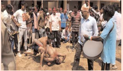
పెద్దలు, యువకులు మల్ల యోధులు తదితరులు పాల్గొన్నారు.