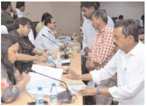
నిజామాబాద్ అర్బన్ ప్రజాజ్యోతి మార్చ్ 11 సమీకృత జిల్లా కార్యాలయాల