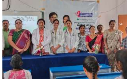
అవగాహన ప్రముఖ శ్రీల వైద్య నిపుణులు డాక్టర్ బోయి

గంభీరాపుపేట ఫిబ్రవరి 5 (ప్రజా జ్యోతి) : గంభీరాపుపేట మండల కేంద్రంలోని ప్రభుత్వ కేజీ టు పీజీ డిగ్రీ కళాశాలలో విద్యార్థినిలకి గర్భాశయ వ్యవస్థ నిర్మాణం పని చేసే పద్ధతి, నెల సరి రోజుల లో వచ్చే సమస్యలు రాకుండా ఎలా జాగ్రత్తలు తీసుకోవాలి గర్భాశయ ముఖద్వార క్యాన్సర్ నివారించడానికి వ్యాక్సిన్ గురించి అవగాహన రొమ్ము క్యాన్సర్ నీ ముందస్తు గా గుర్తించడానికి తెలుసుకునే పద్ధతులు రక్ష హీనత గురించి నివారించడానికి పౌష్టిక విలువలు ఉన్న ఆహారం గురించి