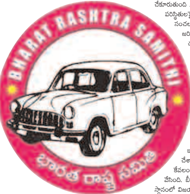
నిడమనూరు,మార్చి 05(ప్రజాజ్యోతి):వచ్చే పార్లమెంట్ ఎన్నికల తర్వాత రాష్ట్రంలో బీఆర్ఎస్ భవితవ్యం ప్రమాదంలో పడుతుందని పీకే వ్యాఖ్యలకు బలం

లోక్ సభ ఎన్నికల్లో గులాబీకి కష్టకాలం రెండు స్థానాల్లోకే పరిమితం..? వెల్లడించిన ఇండియా టీవీ సర్వే లోక్ సభ ఎన్నికల తర్వాత ఆ పార్టీ మనుగడే ప్రశ్నార్థకం రాష్ట్రంలో ప్రత్యామ్నాయంగా బీజేపీ బలపడుతోంది ఆంధ్రాలో వైసీపీ ఓటమి ఖాయం జగన్.. కేసీఆర్ ను ఫాలో అవుతున్నారు ది న్యూ ఇండియన్ ఎక్స్ ప్రెస్ 'హైదరాబాద్ డైలాగ్స్' డిబేట్ లో స్టాటస్ జస్టి పీకే