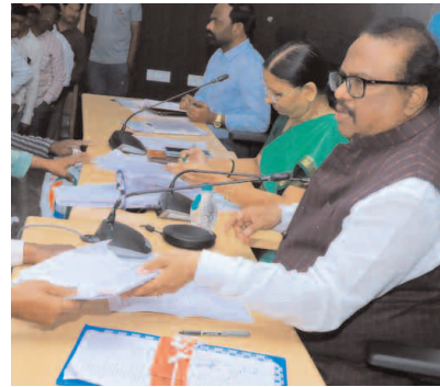
ఎన్నికల్లో నియమించిన నోడల్ అధికారులు, సెక్టార్ అధికారులు ఎంతో నిబద్ధతతో పని చేసారని వచ్చే

కలెక్టర్ మాట్లాడుతూ వేసవి దృష్ట్యా గ్రామాలు,పట్టణాల్లో నీటి ఎద్దడి రాకుండా సంబంధిత అధికారులు నిరంతరం క్షేత్ర స్థాయి పర్యటనలు చేయాలని సూచించారు.ముఖ్యంగా గ్రామాల్లో జాబ్ కార్డ్ ఉన్న కూలీలకు ఉపాధి హామీ పథకం ద్వారా ఉపాధి పనులు కల్పించాలని సూచించారు.ప్రజాపాలన సేవ కేంద్రాల లలో దరఖాస్తుల పరిశీలన ప్రక్రియ వేగవంతం చేయాలని ఆదిత్య ప్రత్యేక అధికారులు నిరంతర పర్యవేక్షణ చేయాలని సూచించారు.అదేవిధంగా జిల్లాలో వచ్చే లోక్ సభ ఎన్నికల నేపథ్యంలో స్వీప్ కార్యక్రమాలు నియోజక వర్గాల వారీగా చేపట్టాలని,గత శాసన సభ