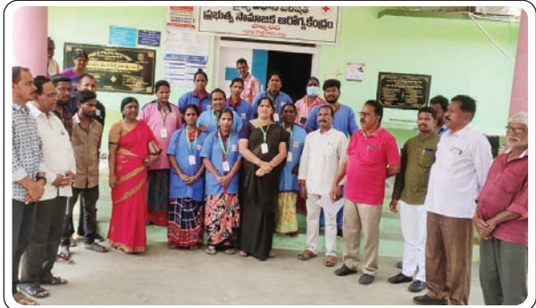
పాల్వంచ, మార్చి 29, ప్రజాజ్యోతి:

- సూపరింటెండెంట్ కు సమ్మె నోటీసు ఇచ్చిన ఏఐటీయూసీ నాయకులు