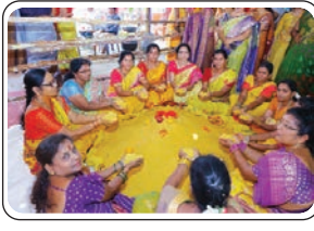
పాల్వంచ, మార్చి 29, ప్రజాజ్యోతి:

భద్రాద్రి కొత్తగూడెం జిల్లా, పాల్వంచ పట్టణ పరిధిలోని శ్రీనివాసకాలనీ శ్రీనివాసగిరి శ్రీ వేంకటేశ్వర స్వామి దేవస్థానం (గుట్ట) నందు ఏప్రిల్ 03 నుండి ఏప్రిల్ 6వ తేదీ వరకు జరుగు వార్షిక కళ్యాణంలో భాగంగా ఏప్రిల్ 04న జరుగు శ్రీదేవి,