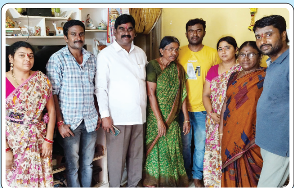
పాల్వంచ, మార్చి 29, ప్రజాజ్యోతి: