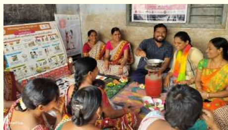
చిరుధాన్యాల పోషకాహార పద్ధతులపై అవగాహన