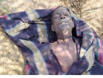
మెట్ పల్లి ప్రతినిధి మార్చ్ 2 ( ప్రజా జ్యోతి) : చెరువునీటిలో మునిగి పశువుల కాపరి మృతి చెందిన ఘటన మెట్ పల్లి మండలం వెంపేట్ లో చోటుచేసుకొంది.