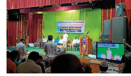
చాలాకాలంగా జర్నలిస్టులకు ఇళ్లస్థలాలు ఇచ్చే అంశంపై