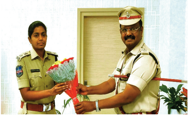
వసపర్తి ప్రతినిధి, ఫిబ్రవరి 27(ప్రజా జ్యోతి):సాధారణ

- జిల్లా ఎస్పీకి పుష్పగుచ్ఛం అందజేసి బాధ్యతలు స్వీకరణ