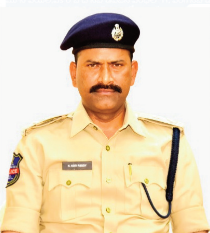
వికారాబాద్ ప్రతినిధి, ఫిబ్రవరి 26(ప్రజా జ్యోతి):

ఇంటర్ పరీక్షల సందర్భంగా జిల్లాలో పాటిష్ట బందోబస్త ఏర్పాటు చేయడం జరిగిందని జిల్లా ఎస్పీఎన్ కోటిరెడ్డి తెలిపారు. జిల్లాలో ని అన్ని పరీక్షల కేంద్రాల దగ్గర 144 సెక్షన్ ఉంటుంది. కావున ఎవ్వరు కూడా పరీక్ష కేంద్రాల దగ్గర గుమికూడవద్దు, ఎవరైనా పరీక్ష కేంద్రాల దగ్గర చట్ట వ్యతిరేక కార్యక్రమాలకు పాల్పడితే కఠినమైన చర్యలు తీసుకోవడం జరుగుతుందని హెచ్చరించారు. పరీక్ష కేంద్రాల చుట్టుపక్కలలో ఉన్నటువంటి జిరాక్స్ కేంద్రాలు పరీక్ష ల సమయం లో మూసి వేయలి,వికారాబాద్ సబ్ డివిజన్ పరిధిలో 11, పరిగి సబ్ డివిజన్ పరిధిలో 9 మరియు తాండూర్ సబ్ డివిజన్ పరిధిలో 9 మొత్తం జిల్లాలో 29 పరీక్ష కేంద్రాలు ఉన్నాయి. పరీక్ష కేంద్రాలలోకి ఎవ్వరికి కూడా సెల్ ఫోన్ లకు అనుమతి లేదన్నారు. జిల్లా ప్రజలు ఇట్టి విషయం పైన దృష్టి సారించి పోలీస్ అధికారులకు సహకరించాలని ఎస్పీ తెలిపారు.