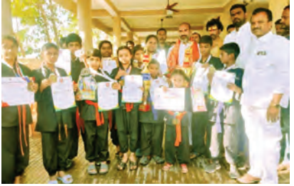
వేములవాడ, ఫిబ్రవరి 23, (ప్రజాజ్యోతి): ఈ నెల 18వ తేదీన హైదరాబాద్ కోట్ల విజయభూస్లం రెడ్డి యుసేఫ్ గూడ స్టేడియం నందు రుద్రమచేవి పాటకన్ డో సెల్వే డిప్యూటీ అకాడమీ నిర్వహించిన 4వ నేషనల్ ఓపెన్ కరాటే, కుంగ్ ఫు ఛాంపియన్ షిప్-2024 బోర్డుమెంటులో ప్రతిభ