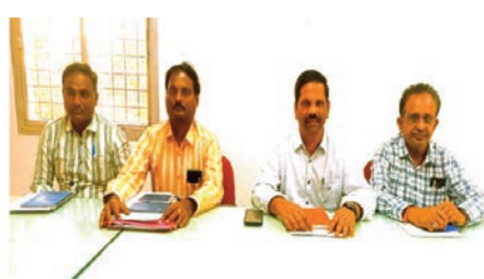
మెదక్ ప్రజాజ్యోతి : వినియోగదారులకు

- టీఎస్ ఎన్పీడీసీఎల్ ఎస్ఈ జానకిరాములు - జిల్లా విద్యుత్ శాఖ అధికారులు, సిబ్బందితో సమీక్షా సమావేశం