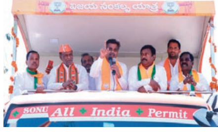
షాబాద్ ప్రజాజ్యోతి ప్రతినిధి (21.02.2024)... ఈ యాత్రలో ఓ.బీ.సీ మోర్చా జాతీయ అధ్యక్షులు డాక్టర్