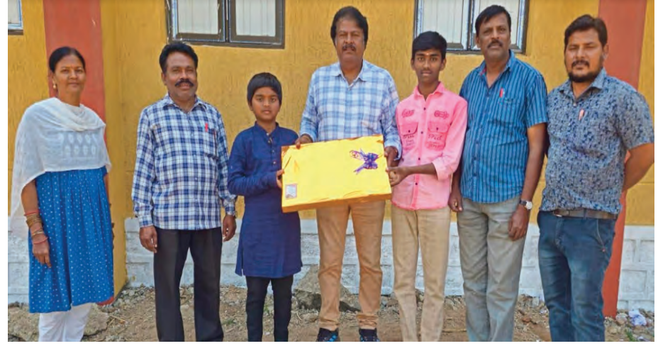
మెట్పల్లి ప్రతినిధి ఫిబ్రవరి 21 ( ప్రజాజ్యోతి ) : అమ్మ ఒడే శిశువుకు తొలిబడియని, అమ్మ మాటే

మాతృభాషయని, అమ్మను ప్రేమించినట్లే మాతృభాషను కాపాడుకోవాలని - ప్రముఖ