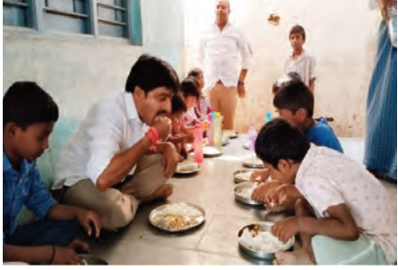
రాజోలి, ఫిబ్రవరి 21, ప్రజాజ్యోతి : రాజోలి