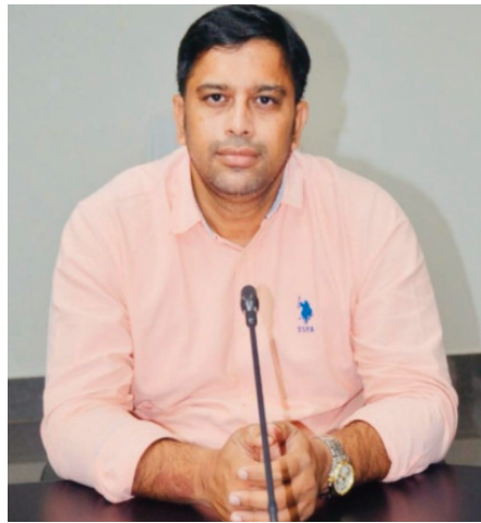
వికారాబాద్ ప్రతినిధి ఫిబ్రవరి 19 (ప్రజా జ్యోతి):

జిల్లాలోని ప్రైవేటు ఆసుపత్రులు అన్నింటినీ జిల్లా వైద్య ఆరోగ్యశాఖ అధికారి కార్యాలయంలో రిజిస్ట్రేషన్ చేసుకుని ఉండాలని వికారాబాద్ జిల్లా వైద్య ఆరోగ్యశాఖ అధికారి డాక్టర్ పల్వన్ కుమార్ తెలిపారు. ప్రైవేట్ ఆసుపత్రులలో కాన్పులు చేసేవారు తప్పనిసరిగా రిజిస్ట్రేషన్ చేసుకుని ఉండాలని రిజిస్ట్రేషన్ లేని వారిపై చట్టరీత్యా చర్యలు తీసుకోబడునని హెచ్చరించారు. ప్రైవేట్ ఆసుపత్రుల వారు గైనకాలజిస్టులు చేసిన కాన్పుల వివరములను వెంటనే ఈ బర్త్ రిజిస్ట్రీ లో ఎంట్రీ చేయాలన్నారు. ప్రాధాన్యతగా అన్ని సహజ కాన్పులు చేసేటట్లు చూడాలన్నారు. ఇండికేషన్ లేకుండా అనవసరంగా కోత కాన్పులు అనగా సిజేరియన్ కాన్పులు నిర్వహించరాదని చెప్పారు. అనవసర సిజేరియన్ కాన్పులు చేసినచో ఆసుపత్రి పైన సంబంధిత గైనకాలజిస్ట్ పైన చట్ట రీత్యా చర్యలు తీసుకోబడనని హెచ్చరించారు.