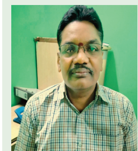
వికారాబాద్ ప్రతినిధి, ఫిబ్రవరి 19 (ప్రజా జ్యోతి):

అంశంపై వ్యాస రచన పోటీ నిర్వహించడం జరుగుతుందని, 300 వదాలతో ఇంగ్లీషు, తెలుగు, హిందీ భాషల్లో రాయవచ్చని అన్నారు. “సమృద్ధిని యొక్క పొదుపు శక్తి “ అనే అంశంపై నినాదాల పోటీని నిర్వహించడం జరుగుతుందని తెలిపారు. పోస్టర్ ఊటీ “ డిజిటల్, సైబర్ పరిశుభ్రత “ అనే అంశంపై చేతితో ద్రా లేదా డిజిటల్ గా కానీ ఇంగ్లీష్, తెలుగు , హిందీ భాషల్లో వేయవచ్చునని అన్నారు. పాల్గొనే వారి పేరు, పబ్లిక్ , ప్రైవేట్ , పాఠశాల కళాశాల పేరు, పాల్గొనే వారి వయసు, ఫోన్ నెంబర్, పార్సిపేట్ గార్డియన్ పేరు దరఖాస్తులో పేర్కొనాలని సూచించారు. జిల్లా స్థాయిలో నిర్వహించే ఈ మూడు పోటీలలోని విజేతలకు బహుమతి , సర్టిఫికేట్ ప్రధానం అదేవిధంగా రాష్ట్ర స్థాయిలో బహుమతి, సర్టిఫికేట్ తో పాటు సన్మానం చేయడం జరుగుతుందని ఆయన తెలిపారు. ప్రభుత్వ ప్రైవేటు, విద్యా సంస్థల విద్యార్థులు ఈ పోటీలో పాల్గొనేందుకు ఈనెల 22 సాయంత్రం 5 గంటల లోపు లీడ్ బ్యాంక్ మేనేజర్ ఈ మెయిల్ ldm.vikarabad@gmail.com కు వ్యాసం, నినాదం, పోస్టర్ వివరాలు పంపించాలని ప్రకటనలో పేర్కొన్నారు.