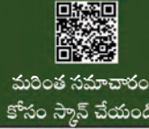
మరింత సమాచారం కోసం స్కాన్ చేయండి