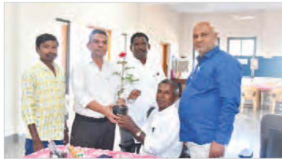
గద్వాల (ప్రజాజీవితం) ఫిబ్రవరి 17: జోగులాంబ గద్వాల జిల్లా పౌర సంబంధాల అధికారిగా నూతనంగా