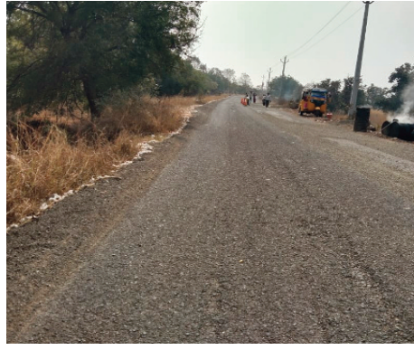
మునిపల్లి ఫిబ్రవరి 17 (ప్రజా జ్యోతి) జాతీయ రహదారి 65 కంకుల్ చౌరస్తా నుండి రాయికోడ్ చౌరస్తా వరకు మంజూరైన ఆర్ అండ్ బి తార రోడ్డు

పనులు కొనసాగుతున్నాయి. కంకోల్ చౌరస్తా నుండి రాయికోడ్ వరకు రోడ్డు ప్యావ్ వర్క్ పూర్తిచేసి అవసరమైన చోట తారు రోడ్డు వేస్తున్నారు. దీంతో గత పది సంవత్సరాల నుండి గుంతల రోడ్డుతో తీవ్ర సమస్యలు, ప్రమాదాలు ఎదుర్కొంటున్న ప్రజలు ప్రస్తుతం పనులు చురుకుగా జరుగుతుండటంతో సంతోషం వ్యక్తం చేస్తున్నారు. రోడ్డు పనుల్లో గతంలో లాగా నాసిరకం మెటీరియల్ వాడకుండా నాణ్యమైన కంకర, డాంబర్ తదితర పస్తువులను నిబంధనల మేరకు వాడాలని దీర్ఘకాలం పాటు రోడ్డు పాడవకుండా చూడాలని సంబంధిత కాంట్రాక్టర్లకు, ప్రభుత్వ అధికారులకు ప్రజలు కోరుతున్నారు.