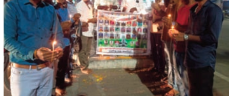
జనగామ, ఫిబ్రవరి 14 (ప్రజాజ్యోతి):- 2019