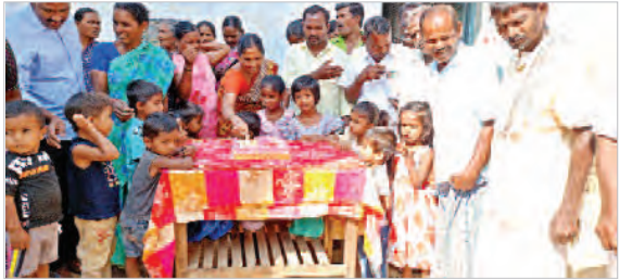
వేడుకలకు, ఫిబ్రవరి 13 (ప్రజా జ్యోతి)

అధికారుల మండల కేంద్రంలోని మూడవ అంగన్వాడీ సెంటర్ లో సోమ వారము అధికారుల మండల జెడ్పీసీని రాజశేఖర్ రెడ్డి బర్త్ డే సెలబ్రేషన్స్ బిఆర్ఎస్ కార్యక్రమంలో కలిసి అంగన్వాడీ సెంటర్ లో కేక్ కట్ చేసి సెలబ్రేషన్స్ నిర్వహించారు. అంగన్వాడీ బాల బాలికలకు, బిఆర్ఎస్ కార్యక్రమాలకు కేక్ కట్ చేసి తినిపించి బర్డ్ డే సెలబ్రేషన్స్ జరుపుకున్నారు. ప్రభుత్వ నిబంధనలకు విరుద్ధంగా ప్రభుత్వ కార్యాలయాల, పాఠశాలలు, అంగన్వాడీ కేంద్రాలలో రాజకీయ నాయకుల పుట్టినరోజు వేడుకలు నిర్వహించటం ఏంటని చలవూరు విమర్శిస్తున్నారు. ఈ విషయం గురించి బిసెడిఎస్ సూపర్ వైజర్ జ్యోతిని వివరణ కోరగా అంగన్వాడీ సెంటర్ లో ఎలాంటి పార్టీ నాయకుల బర్త్ డే సెలబ్రేషన్స్, పార్టీ కార్యక్రమాలు చేయరాదని ఈ విషయం గురించి పై అధికారికి నివేదిక పంపిస్తామని తెలిపారు.