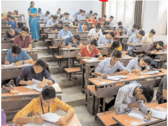
పరీక్షా సెంటర్ కోసం లొకేటెడ్ యాప్

ఫోన్ చేస్తే అందుబాటులోకి సైకాలజిస్టులు ఇంటర్ పరీక్షలకు హాజరు అయ్యే విద్యార్థిని, విద్యార్థులు తరుచూ మానసిక ఒత్తిడికి లోనవుతుంటారు. ఈ పరిస్థితిని గమనించి విద్యార్థుల సౌకర్యార్థం ఈ ఏడాది ఇంటర్ బోర్డ్ ప్రత్యేక సైకాలజిస్టులను అందుబాటులోకి తీసుకువచ్చింది. ఎవరైనా బాలబాలికలు మానసిక పరమైన సమస్యలు ఉంటే ఈ బోర్డ్ ప్రీ నెంబర్ 14416కు ఫోన్ చేస్తే సైకాలజిస్టులు అందుబాటులోకి వచ్చి వారికి ధైర్యాన్ని చెప్తారు. పిల్లల మానసిక పరిస్థితులను పరిగణలోకి తీసుకుని ఈ ఏడాది ఈ విధమైన ఇంటర్ బోర్డు చేసింది. ఈ అవకాశాన్ని సద్వినియోగం చేసుకుంటే చాలా ఉపయోగకరమని విద్యావేత్తలు తెలియజేస్తున్నారు.