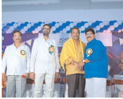
వారి మేలు ఎన్నటికీ మరచనని అన్నారు. ఎంకేఓ