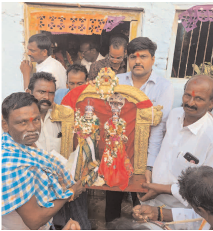
ఊరేగింపు 26న తెలుగు రాష్ట్రాల స్థాయి ఇన్సిటీషన్

పెన్ పహాద్ మండలం ఫిబ్రవరి 24(ప్రజా జ్యోతి): మండల పరిధిలోని చీదేళ్ల గ్రామంలో కొలువై ఉన్న శ్రీలక్ష్మీ తిరుపతమ్మ గోపయ్య స్వాముల జాతర సందర్భంగా శనివారం నుండి ఈనెల 29 వరకు అంగరంగ వైభవంగా నిర్వహించనున్న జాతర కార్యక్రమంలో భాగంగా శనివారం రోజున సుందరంగా అలంకరించిన ఉత్సవ విగ్రహాలను, ఉత్సవ విగ్రహమూర్తులను, తంగళ్ళపల్లి పాండ్య ఇంటిలో దేవత మూర్తుల అలంకరణ అనంతరం గ్రామ పురవీధులలో భాజా భజంత్రీలతో కోలాటాలతో చప్పట్లతో భారీ ఊరేగింపు నిర్వహించారు. ఈ రోజు ఆదివారం గ్రామంలో కోలాటం ప్రభబండ్ల ప్రదర్శన, తంగేళ్లగూడెంలో అమ్మవారి ఊరేగింపు 26న ఊరేగింపుతో గ్రామ పురవీధులలో భాజ భజంత్రీలతో కోలాటాలతో చప్పట్లతో భారీ ఊరేగింపు నిర్వహించనున్నారు. తంగేళ్లగూడెంలో అమ్మవారి