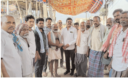
తీరని లోటు అన్నారు. మా గ్రామంలో ఏ