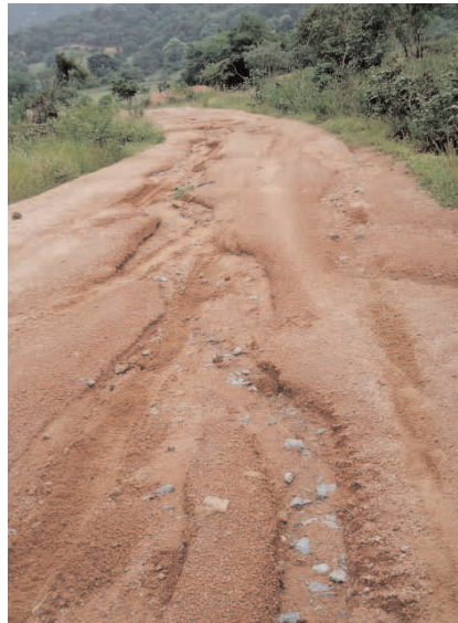
ఆ తండాలో 225 మంది గిరిజనులు