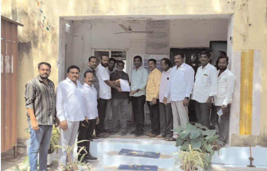
రాకుండా ఉండాలంటే శాశ్వత పరిష్కారం కోసం రైల్వే అధికారులను కోరారు. ఈ కార్యక్రమంలో ఆయా గుండ్లగూడెం గేట్ వద్ద అండర్ పాస్ బ్రిడ్జ్ నిర్మించాలని గ్రామాల పెద్దలు, ప్రజలు, నాయకులు పాల్గొన్నారు.

అలేరు, ఫిబ్రవరి 13 (ప్రజాజ్యోతి): అలేరు మండలంలోని గుండ్లగూడెం, పబ్లిక్ గూడెం, శ్రీనివాస పురం గ్రామాలకు రాకపోకలకు ఇబ్బందిగా మారింది ఆవేదన వ్యక్తం చేస్తూ మంగళవారం ఆయా గ్రామాలకు చెందిన ప్రజలు అలేరు పట్టణంలోని రైల్వే సీనియర్ సెక్షన్ అధికారికి వినతి పత్రం ఈ సందర్భంగా వారు మాట్లాడుతూ అలేరు పట్టణానికి సమీపంలో ఉన్న గుండ్లగూడెం గేట్ వద్ద గత ఆరు రోజులుగా రైల్వే ట్రాక్ మరమ్మత్తుల పనులు జరుగుతున్నాయని, దీంతో ఆయా గ్రామాలకు చెందిన ప్రజలు పట్టణానికి రాకపోకలకు ఇబ్బందిగా మారింది, మూడు గ్రామాల చెందిన ప్రజలకు రవాణా వ్యవస్థ నిలిచిపోవడంతో సకాలంలో వైద్య సేవలు అందక ఇటీవల ఒక మహిళ మృతి చెందిందని ఆవేదన వ్యక్తం చేశారు. ప్రస్తుతం ఇచ్చిన సమయం వరకు పనులు పూర్తి చెయ్యకుండా ఇంకా రైల్వే గేట్ ని తియ్యడం లేదని రైల్వే ఆయా గ్రామాల ప్రజలు విజ్ఞప్తి చేస్తూ అలేరు రైల్వే స్టేషన్ సమీపంలో నున్న సీనియర్ సెక్షన్ ఇంచార్జ్ కి వినతిపత్రం అందజేశారు. భవిష్యత్తులో ఇలాంటి ఇబ్బందులు