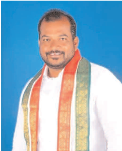
కట్టబెట్టిన కేసీఆర్ ఏ ముఖం పెట్టుకొని నల్లగొండలో సభ పెడుతున్నాడని ప్రశ్నించారు. కాంగ్రెస్ పార్టీ గత